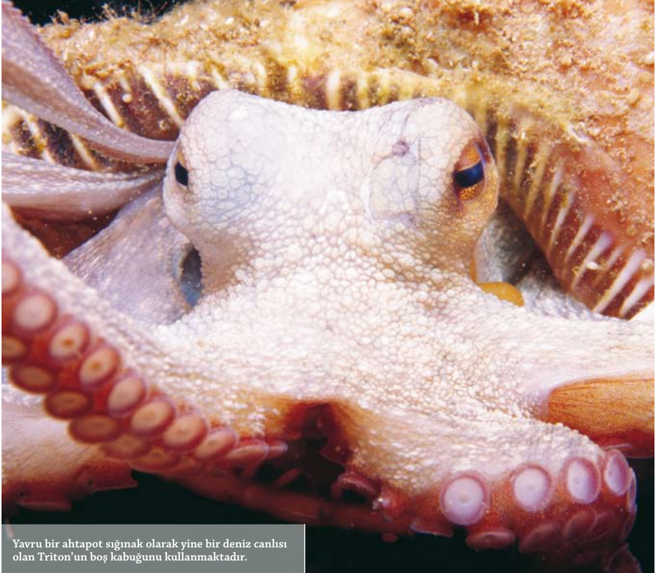
Yavru bir ahtapot sığınak olarak yine bir deniz canlısı olan Triton'un boş kabuğunu kullanmaktadır.

olan ahtapotlar, kafadan bacaklılar grubunda yer almaktadırlar. 300 civarında türü bulunan ahtapotların uzunlukta 10 metreye, ağırlıkta 200-300 kg.'a kadar ulaşan boyutları varken, birkaç santim büyüklükte olan türleri de mevcuttur. Her canlıda olduğu gibi korunma içgüdüsüne ahtapotlarda da rastlanılır. İnsanlar için tamamen zararsız olan bu canlılar, güçlü kollarını avlanma ya da korunma için kullanmaktadırlar. Aktif avcı statüsündeki canlıların temel özelliklerinden biri olan gelişmiş görme duyusu, omurgalılarla kıyaslanabilecek düzeydedir. Kafa bölgesinden çıkan ve uzunluğu türler arasında farklılaşan vantuzlu güçlü kollarını, ünlü yazar Victor Hugo "Les Travailleurs de la Mer-Denizin İşçileri" adlı romanında; deri gibi elastik, çelik kadar sert ve gece gibi soğuk sözleriyle ifade etmiştir.